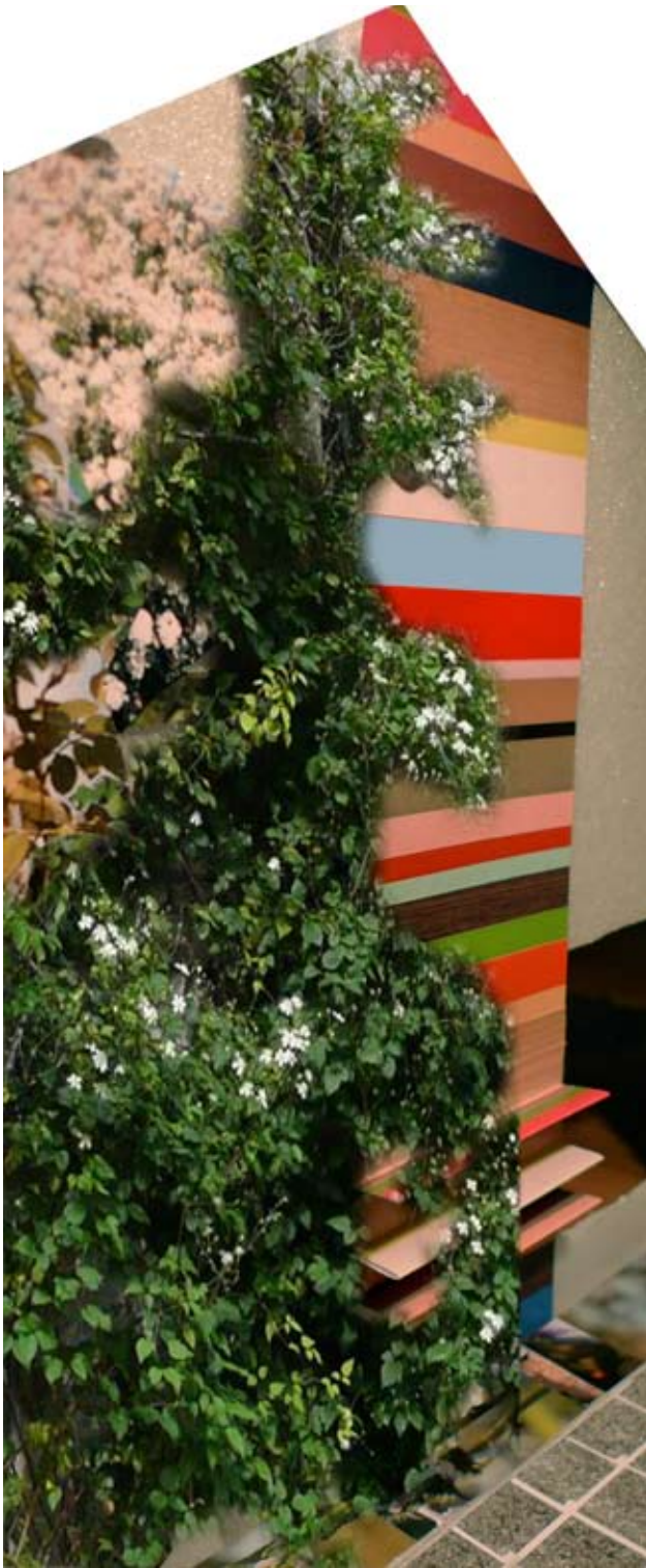
Væggen mod vest

Bemalet træbeklædning på vægstykket mellem vinduerne ind mod netcaféen. Forneden på væggen i "beskuer-højde" arrangeres sommerfuglepupper.